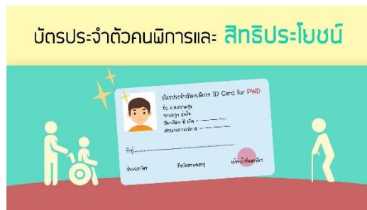
ตัวอย่างบัตรประจำตัวผู้พิการ

- กรณีได้รับเบี้ยยังชีพคนพิการอยู่แล้วและได้ย้ายเข้ามาในพื้นที่ตำบลคลองเรือ จะต้องมาขึ้นทะเบียนที่ องค์การบริหารส่วนตำบลคลองเรือ การขึ้นทะเบียนขึ้นได้ตลอดเวลา ในวัน เวลาราชการ ผู้พิการขึ้นทะเบียนในเดือนนี้ ประกาศรายชื่อนี้เดือน รับเบี้ยยังชีพเดือนถัดไป (ตามระเบียบกระทรวงมหาดไทยว่าด้วยหลักเกณฑ์การจ่ายเงินเบี้ยความพิการให้คนพิการขององค์กรปกครองส่วนท้องถิ่น (ฉบับที่ ๒) พ.ศ. ๒๕๕๙ ข้อ ๗